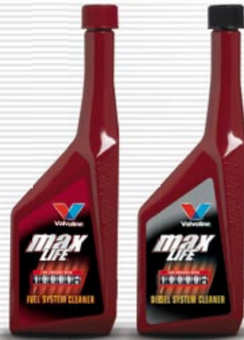
MaxLife® Fuel/Diesel System Cleaners