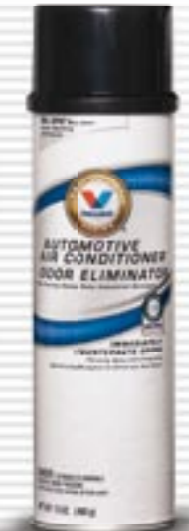
Air Conditioner Odor Treatment

Wystarczy niewielka ilość produktu: jeden pojemnik Valvoline Air Conditioner Odor Treatment wystarczy na trzy zastosowania.