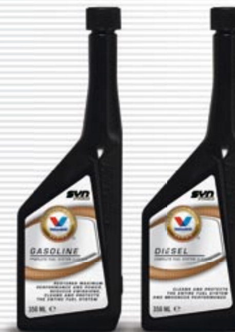
SynPower® Complete Gasoline/Diesel System Cleaners