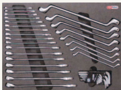
813.1103 Zestaw kluczy płasko-oczkowych i oczkowych odgiętych, 34 części