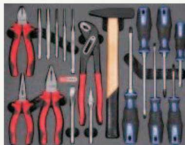
813.1102 Zestaw szczypiec i wkręteków 18 części